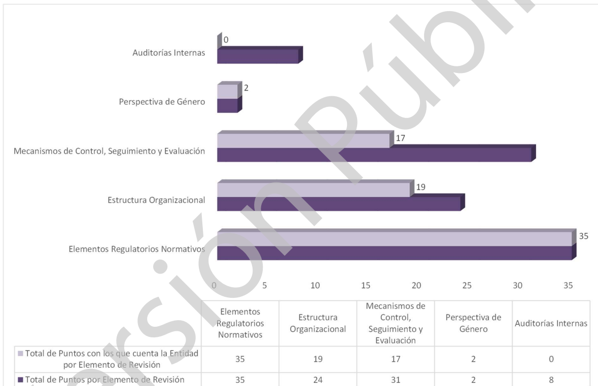
Grafica 1 Cumplimiento de los Mecanismos de Control Interno Ejercicio 2020